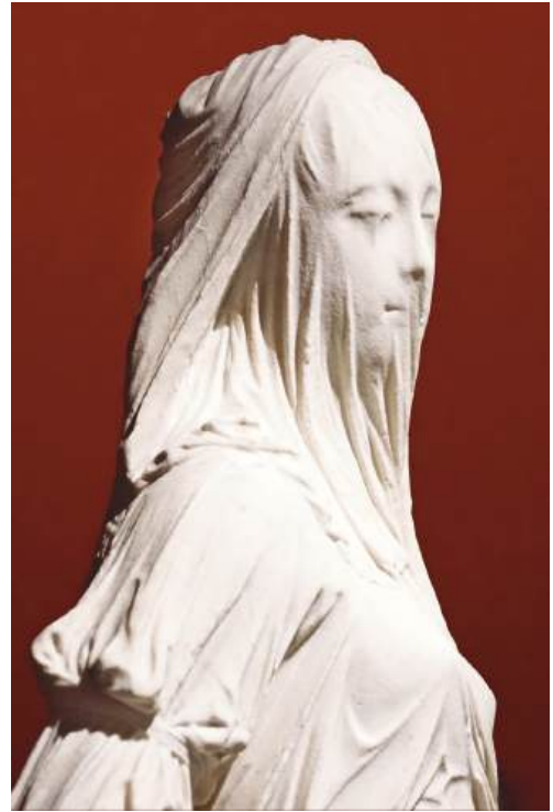
Fig. 4. París. Grand Palais. Alegoría de la Fe o Mujer velada. Antonio Corradini. 1751.

que mostrar al fiel la verosimilitud de la esperanza en la Resurrección, el camino de la Verdad, la Fe y la Vida. No deja de recrearse aquí el cumplimiento de la escritura santa (Mateo 27, 51): «En ese momento el velo del templo se rasgó en dos, de arriba abajo; la tierra tembló y las rocas se partieron», significando que el sancta sanctorum no quedaba ya reservado para el sumo sacerdote, sino que era abierto a toda la humanidad a través de la redención de Jesucristo.