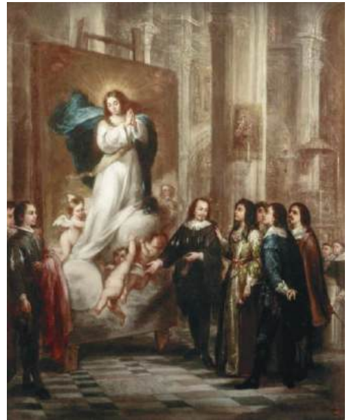
Fig. 2. Sevilla. Museo de Bellas Artes. Murillo presentando su lienzo de la Inmaculada . c.1860. José María Romero.

sostiene el velo que acaba de descolgarse del bastión del lienzo), muestra al pintor sevillano como un nuevo San Lucas, el retratista de la Virgen, trasunto real en la monarquía hispánica de la Contrarreforma 12 .