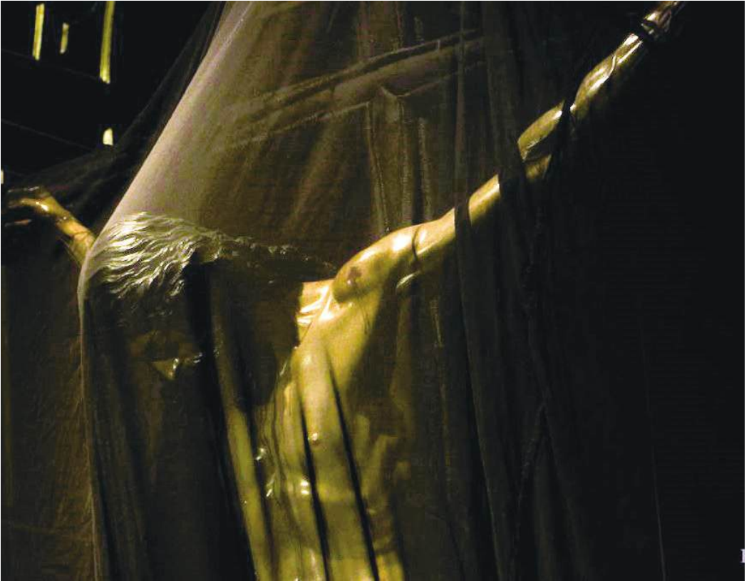
Fig. 8. Sevilla. Capilla universitaria. Santísimo Cristo de la Buena Muerte. Juan de Mesa. 1620.

custodia la degradación visual de Dorian Gray, el objeto velado se confirma (sobre todo si es un objeto artístico), como el dispositivo central de la estética barroca; una cosmovisión donde la verdad no reside en la transparencia, sino en el rito del desvelamiento, sugiriendo que la esencia de la identidad –ya sea la santidad de la «milicia divina» o la corrupción del alma–, solo adquiere su significado pleno cuando es re-velada o des-velada con el símbolo procurado por el arte.