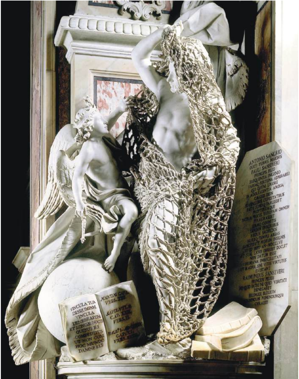
Fig. 6. Nápoles. Capilla Sansevero. El Desengaño. Francesco Queirolo. 1754.