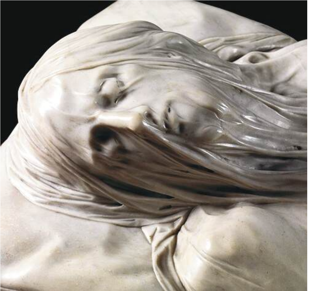
Fig. 5. Nápoles. Capilla Sansevero. Cristo velado. Giuseppe Sanmartino. 1753.

La importancia de estas ceremonias ha sido tanta que, en el correr de los siglos y a pesar de los cambios de la contemporaneidad, ha seguido vigente en determinadas circunstancias: por un lado, quizá la referencia literaria más clara sea el estado en el que Dorian Gray oculta su famoso retrato: