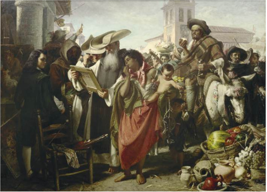
Fig. 3. Oviedo. Museo de Bellas Artes de Asturias. La temprana carrera de Murillo , 1634. John Phillip. 1865.

anécdota recogida por Plinio, hasta el punto de que la perfección de la técnica de Murillo lo constituiría como una nueva versión de los autores griegos 13 . La importancia del acto de velar y desvelar, de cubrir y conocer, de don Quijote en este capítulo ha sido advertido y analizado por Hopkins: una relación creativa particular con respecto al mito de los dos pintores, cumple con participar en la construcción de la verosimilitud del episodio pastoril que vendrá a continuación pues, del mismo modo que Don Quijote al ver estas figuras expande su significado mediante su memoria cargada de relatos, alu-