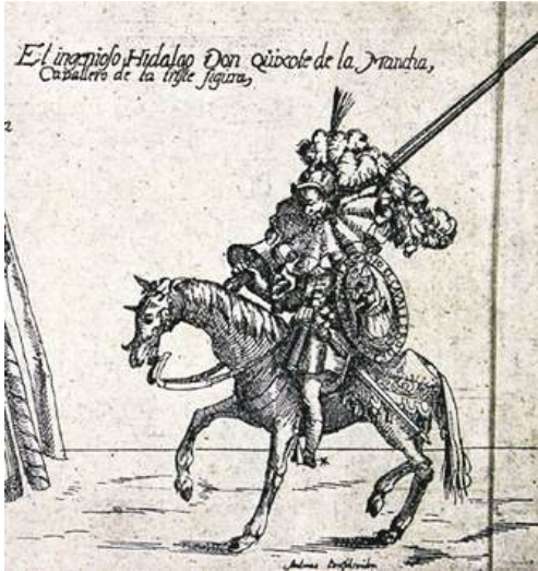
Fig. 1. Cartel, Auffzuge Vers vnd Abrisse, etc. [So bey der Furstlichen Kindtauff vn[d] freudenfest zu Dessa den 27. vnd 28. Octob. vorlauffenden 1613. Jahrs...] publicado por Henning en Leipzig en 1614. Andreas Bretschneider, grabador.

aunque estuviera en él rodeado de muchos dones 2 .