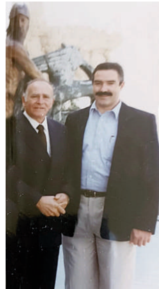
Figuras 9, 10