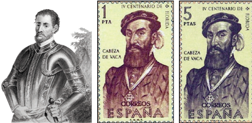
Figura 1 a, b y c

Era de familia hidalga por ambas ramas, tanto los de Vera como los Cabeza de Vaca, acumulaban importantes cargos religiosos, políticos y militares. Su abuelo Pedro de Vera de vital importancia en la conquista de Granada y conquistador de gran Canaria fue alcalde de Cádiz, Arcos y Ximena de la Frontera, muy allegado a la casa de los Ponce de León; y por otra parte, su tío político, fue Pedro de Estopiñán, casado con Beatriz Cabeza de Vaca, hermana de su madre, conquistador de Melilla y adelantado de las indias, muy cercano a la casa de Medina Sidonia. Los Cabeza de Vaca estaban muy asentados en la ciudad de Jerez en esa época y con importantes cargos administrativos.